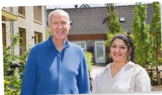
Wout en Zaineب, Wonen Welzijn Mantelzorg