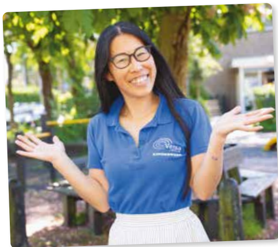
Eri, kinderwerk Bussum