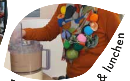
Duurzaam koken & lunchen