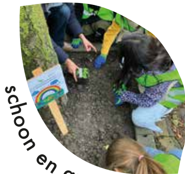
schon en groen

5 keer per jaar organiseert Buurtplatform KTV Naarden een opschoondag. Samen steken we de handen uit de mouwen om zwerfafval te verzamelen. Iedereen kan deelnemen, van jong tot oud.